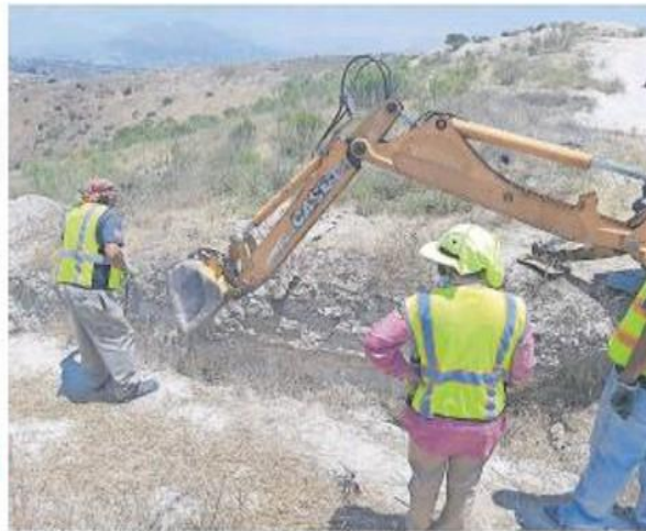
Hallaron los cuerpos en un predio de la colonia Divina Providencia